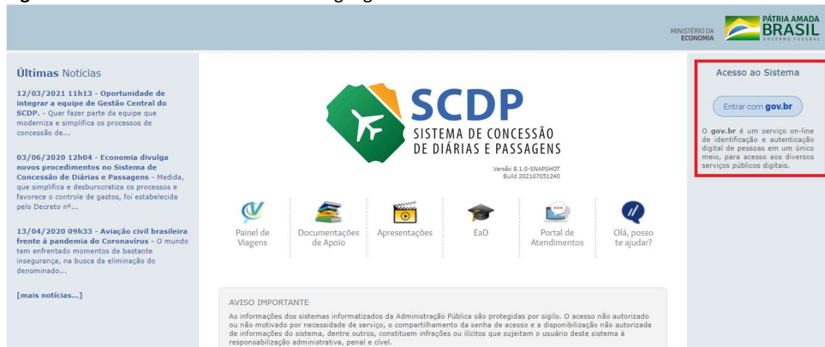
Figura 1: Tela de acesso do SCDP com login gov.br

Após clicar no botão “Entrar com gov.br”, o usuário será direcionado para a tela de acesso do gov.br ( https://sso.ingresso.gov.br ), conforme Figura 2.